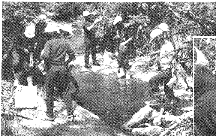
◀ 実地における岩石調査 (ゆとりの学習の時間)