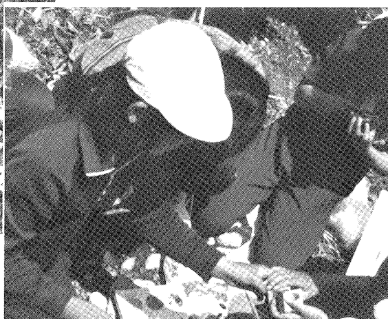
まわってまわって 川内二小