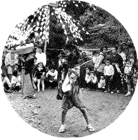
▲江竜田のささら (鮫川村)