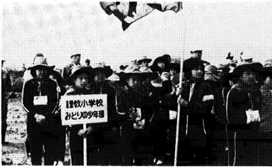
植樹祭開会式（謹教小）