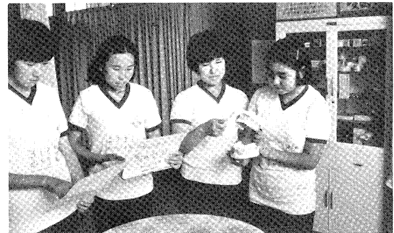
健康な歯のために

健康管理にじゅうぶん留意した指導を徹底している。今年春に行われた三年生の修学旅行では旅行中に体の異常を訴えた生徒は一人もなく全員快適な旅行を楽しむことができた。また部活動も盛んで、今年は地区中体連大会で好成績をおさめ、県大会に三つの部が出場することになった。健康面でも、昨年度のうち治療率九十一・六パーセントという高い実績を認められ、福島県教育委員会並びに福島県歯科医師会より「よい歯の学校優秀校」として表彰をうけている。本校の学校生活の中でもう一つの特徴に生徒の自主活動の時間がある。学校生活全体の中で何事にも意欲的にとりくむ態度、行動の中に気力と活気を培う活動として実践しているもので、現在毎週火、水、金の各曜日の六校時終了後「自主活動時間」として五十分間設けている。愛校作業をはじめ体育レク・学年集会、係活動、学習相談等活発な活動を行っている。