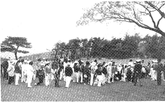
心もウキウキ楽しい遠足

本校は児童生徒に対して、身体的特性や個性、能力に応じた教育を施し、一人一人に希望を与え、みずから障害を克服し、りっぱに社会の一員として自立できるよう、明るく、正しく、たくましくを校是とし、人間育成に重点をおきながら、全職員一丸となり、教育に当たっている。