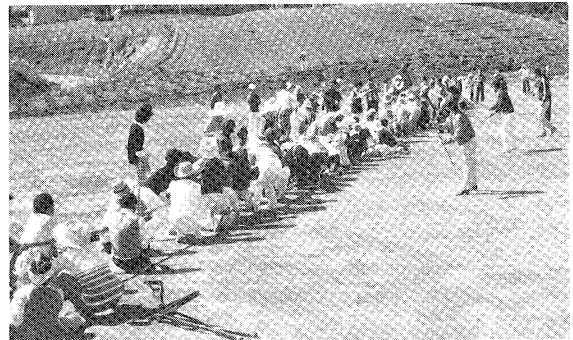
それ／がんばれ（運動会）

現在施設、設備の面でやや貧弱な面があるが、本年度普通教室五、特別教室三、総面積七百八十平方メートルの増築が見込まれ、いっそうの、充実を図り、大きな飛躍をとげようとしている。 また、本年度からは健常者の学校との交流を図り、本校児童、生徒の社会性を啓発するとともに、彼らの理解を深めるよう心がけ、養護教育の真の発展に専心努力しているところである。