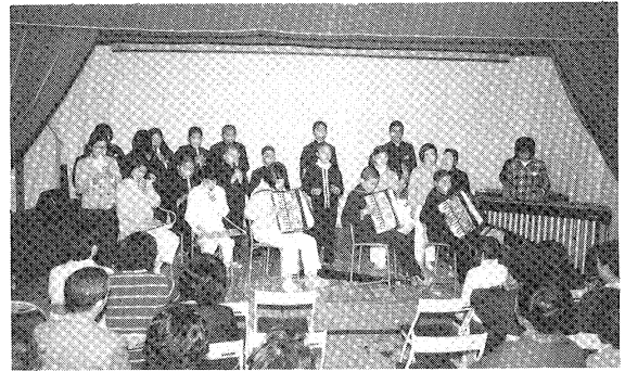
すばらしいメロディ（学習発表会）

本校は、昭和二十八年四月一日平市立平第四小学校特殊学級（肢体不自由児教育学級）として、社会福祉法人福島整肢療護園内に設立され、その後、幾多の変遷を経て、昭和四十五年四月一日福島県立平養護学校として発足した。 昭和五十一年四月一日に国立翠ヶ丘療養所内に設置された平養護学校翠ヶ丘分室が、昭和五十三年四月一日分校に昇格。本年四月一日から養護学校の義務制にともない、本校十六学級、分