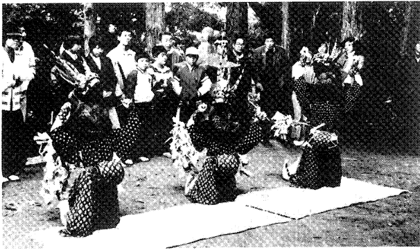
△田子屋の獅子舞（大越町）