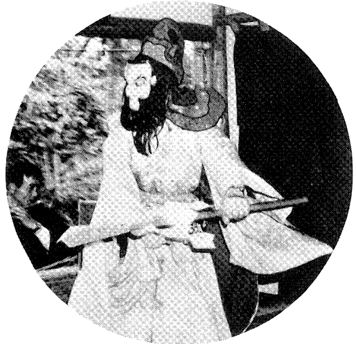
△斎藤の太々神楽（三春町）