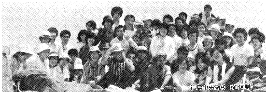
福島中央高校（通信制）