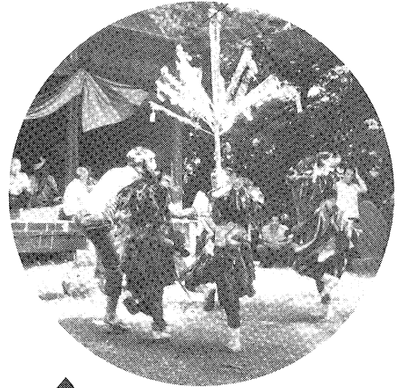
▲ 木幡愛宕神社の獅子舞 (東和町)