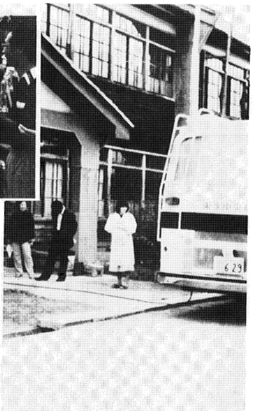
へき地検診車 津島中 ▶