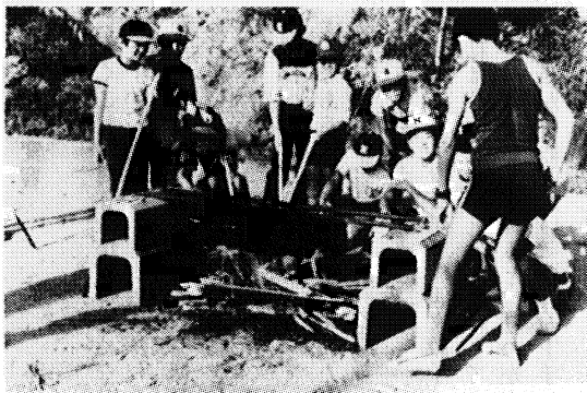
ジュニアリーダー学級（キャンプ）

青少年の健全な育成と、地域子供のリーダーを養成するために、主として、小学校五、六年生のリーダーを対象に開設している。男二十一名、女十四名で、毎月一回学習している。