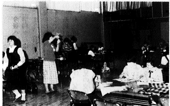
ジュニアリーダー学級