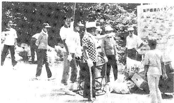
全校生徒によるJRC活動

は校地内にある寄宿舎に入っている。 調和のとれた人間の育成を目指し、 学芸面では、校内弁論大会、合唱コン クール等が恒例となり、時期が近づくと、 美しいハーモニーが各教室から流 れてくる。放課後になると、全員参加 の部活動のため芝生の校庭が生徒でい っぱいになる。クラブ活動も、ダンス クラブのいわきヤッチキおどり、民謡 クラブのジャンガラ念仏おどりなど、 他校にはないユニークな活動も見られ る。