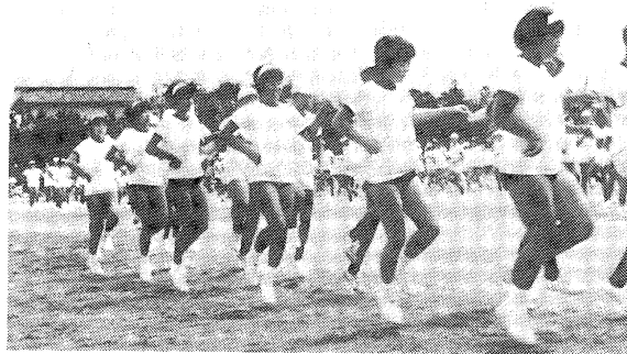
体力づくりのフォークダンス

平駅から北へ約十キロ、夏井川をはき んで純農村の小川町がある。この地の 純朴な気風は、著名な詩人草野心平氏、 ライスキング国府田敬三郎氏、経済学 者榎田民蔵氏を生んでいる。 本校は、旧小玉中、小川中を統合し て昭和三十八年に創設され、以来、環 境緑化では県知事賞、NHK賞などを 受賞し、緑に包まれたすばらしい環境 の中にある。また、学区が広く通学に は列車、バス、自転車を利用する者も多 く、二十二キロ離れた戸渡地区の生徒