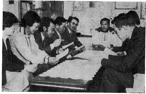
共通理解をはかって