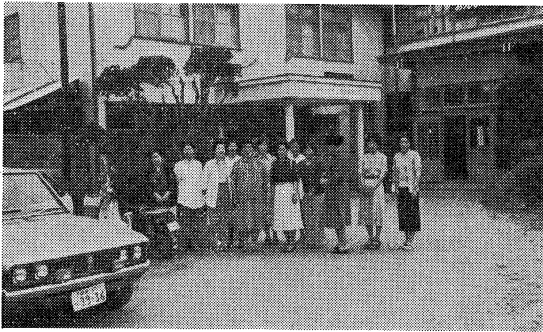
打ち合わせを終えて