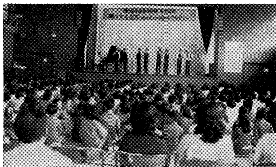
「歌はともだち」ミュージカルアカデミー(金山小体育館)

とも小中学生や父兄、教師等約一万二千五百名の県民が、生の演奏、演技を楽しんだ。 昭和五十六年度「家庭劇場」巡回町村は、次のとおりである。