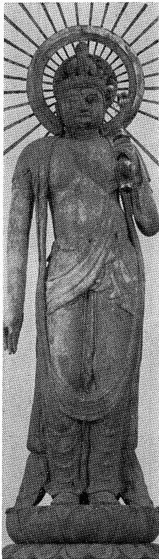
重要文化財木造十一面観音立像(湯川村・勝常寺)