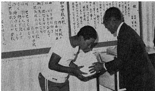
委員長からボールの贈呈

なお、視察内容と教育懇談会の概要については広報誌「声」に掲載し各学校に配布します。