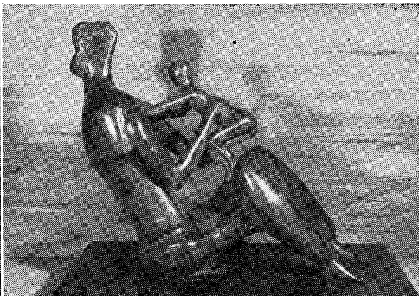
▲ ベン・シャーン「ラッキー・ドラゴン」 ▲ ヘンリー・ムーア 「母と子・腕」（彫刻）