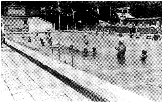
かなづちをなくそう