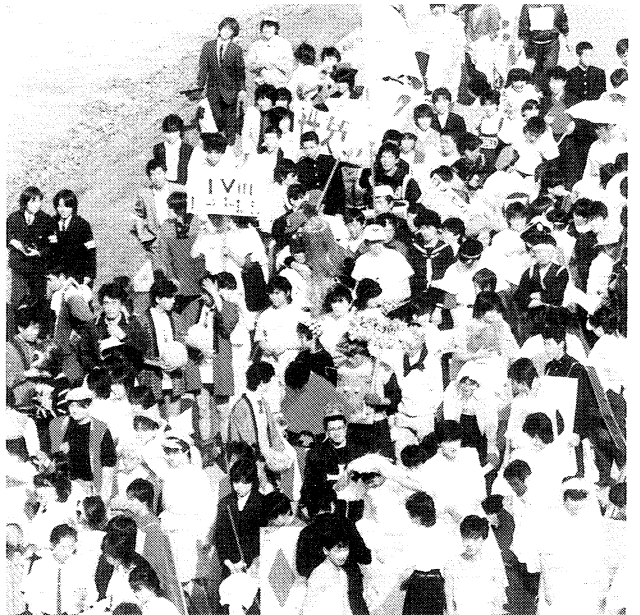
▲仮装行列いよいよ出発!