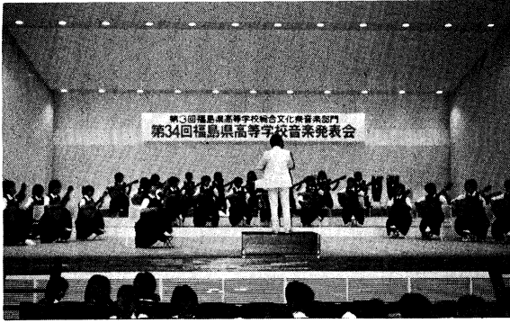
音楽部門発表会(会津若松市民会館)

心豊かな人間性のかん養に資するとともに、高等学校における文化活動の普及と向上を図ることを目的として実施されている県高等学校総合文化祭は、本年度で第三回目を迎え、会津若松市及び喜多方市の両市で盛大に開催された。