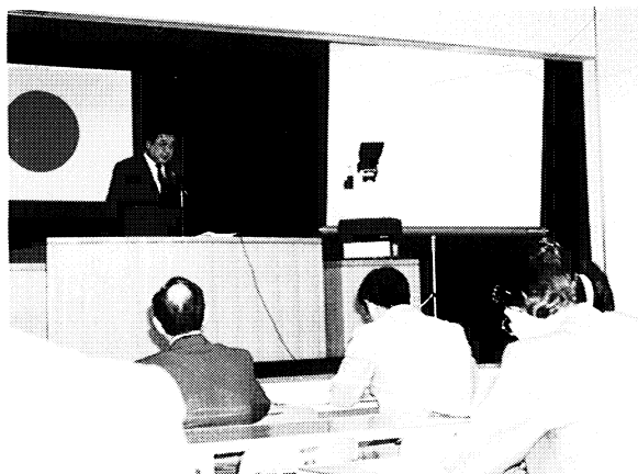
▶O・H・Pを用いた講義

教育事務所所長会議は年十回開催され、教育行政の円滑化を図るため、本庁各課の施策等の説明をうけたりした。(上の写真)