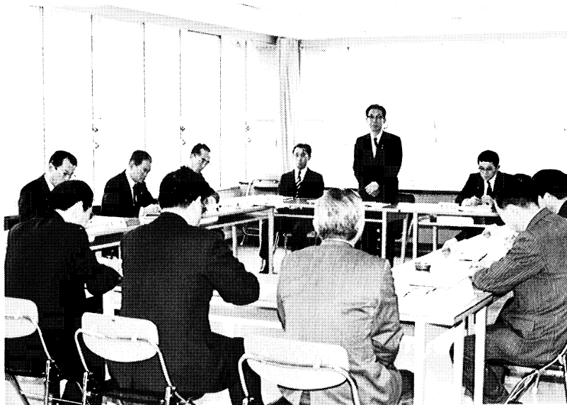
▲説明を聞く各所長