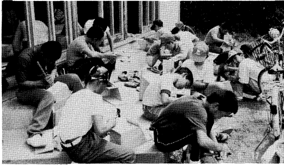
バードウィークにちなんで、巣箱をつくる学級生