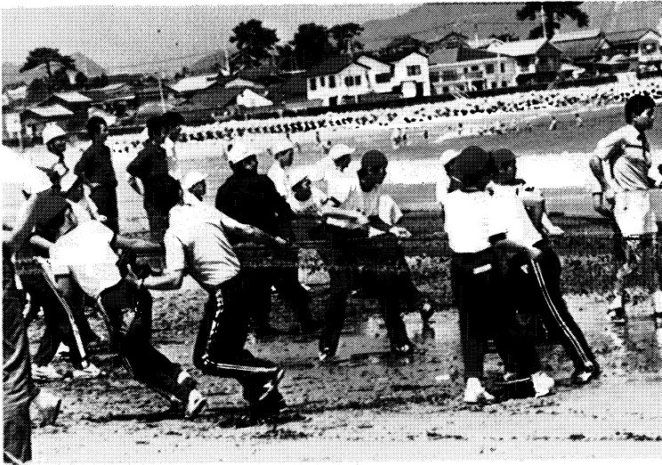
▲魚影に力いっぱい引く

県立相馬高等学校では八月初旬、本年度三回目の全校ホームルームリーダー研修会を行いました。 特に今回は生徒の担当班が執筆してきた「HRの手引」の原稿を各グループ毎に検討会をもち、よりよい高校生活について討論がもたれました。