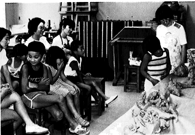
▼造り上げた作品を説明し合う子どもたち