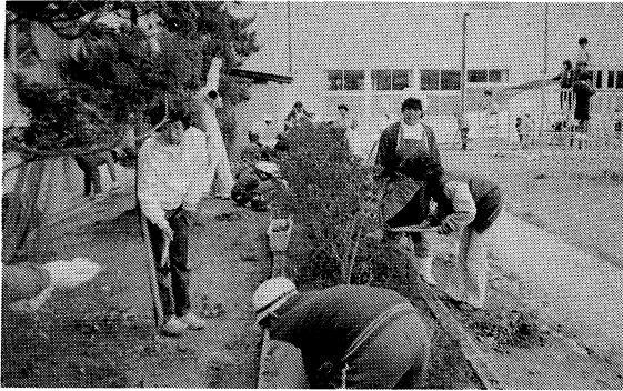
親子環境教室で花壇の手入れ

代表委員会では、「恵まれない子どもたちのために」を議題として話し合い、助け合いをすることを決め、みんな