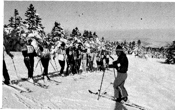
晴天に恵まれた講習会(天元台スキー場)

スキー講習会(四回)開催 一月十八日、十九日の吾妻国際天元台スキー場を皮切りに四回実施されたスキー講習会には、教職員二百四十名が参加いたしました。