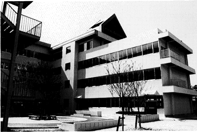
▲本年4月1日開校された富田中学校

真新しい校舎で、五百九十九名の生徒と教職員は一つになって、新しい伝統を築くための一歩を歩み始めました。