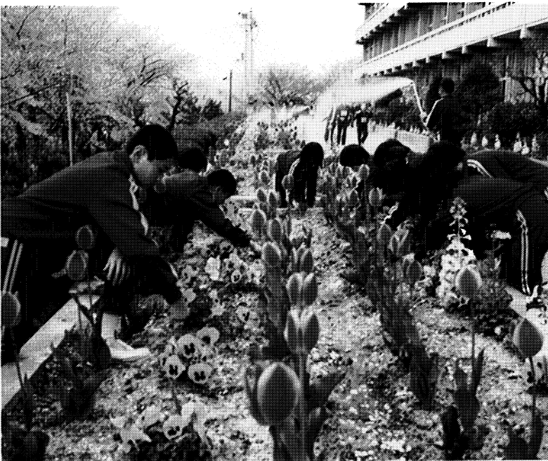
▼勤労体験学習で育てたチューリップ花壇の手入れ

信夫山の南斜面の中腹にある福島四中では、生徒会環境委員会、園芸クラブ、実務学級が中心となり、年中花を絶やさない花壇づくりや、勤労体験学習をとうした学校の環境緑化活動に励んでいる。 咲きほこる美しい草花や花木は、生徒に「憩い」と「潤い」をあたえてくれる。