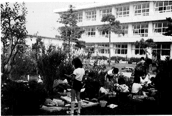
▲美しい前庭を写生する子どもたち