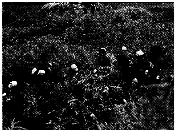
▶力をあわせてグラウンドづくり・矢祭中学校（矢祭町）