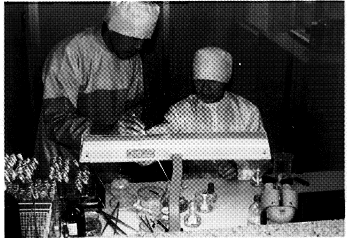
▲これが新しい農業だ・磐城農業高等学校（いわき市）