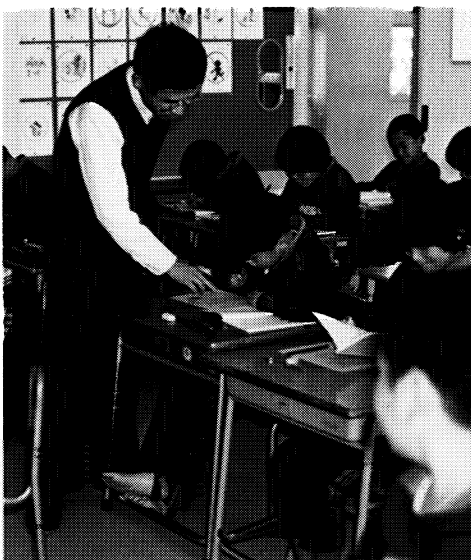
▲一人学びをめざす学習・河内小学校（郡山市）