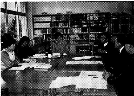
▲熱心に続く話し合い・神指小学校（会津若松市）