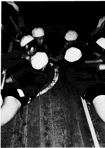
◀楽しく体力づくり・荒館小学校（北会津村）