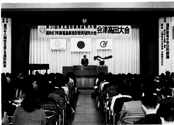
実りある大会となった会津高田大会の開会式

第三十一回東北造形教育研究大会・昭和六十一年度福島県造形教育研究大会が十月二十三日・二十四日会津高田町で開催されました。本年度は「豊かな人間性を育てる造形教育」の主題のもとに、記念講演・研究発表・分科会等が行われ、充実した大会となりました。