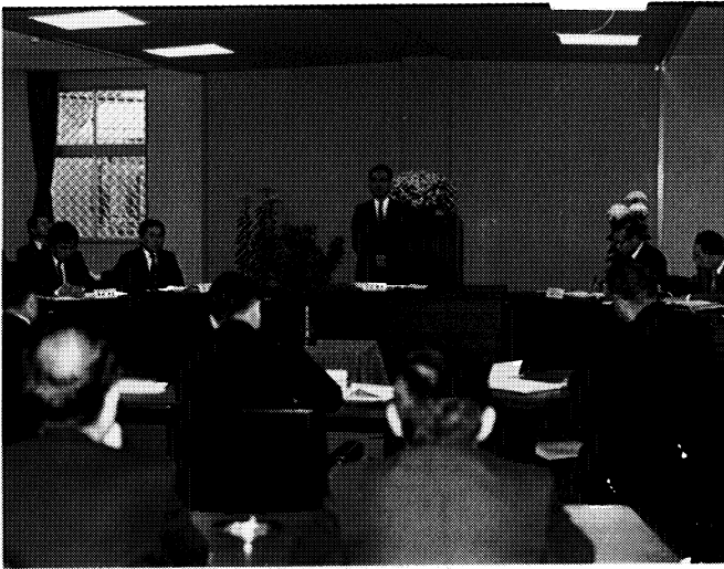
南会津地区で開催された教育広聴会 (田島町)