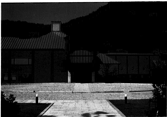
▲福島県立美術館近景