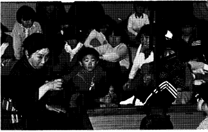
▲体験実習室〈昔語り〉の実演