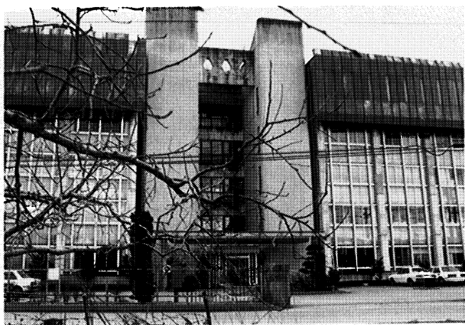
▲教育センター全景