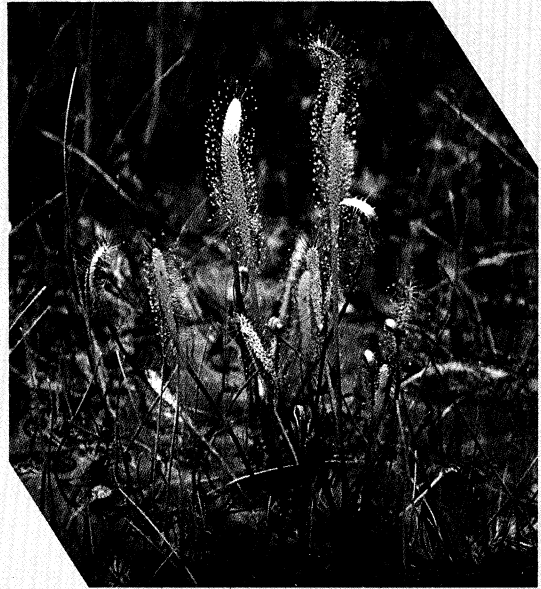
ナガバノモウセンゴケ