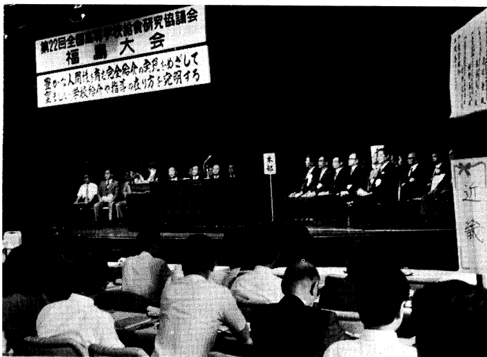
全国より300名が参加した研究協議会の開会式

「学校給食の当面する諸問題」の講演をはじめ、分科会、全体会の研究協議等に活発な意見の交換が行われました。