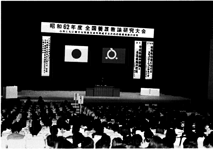
全国養護教諭研究大会の開会式

「心身ともに健全な児童生徒を育成するための養護教諭の役割」を主題に、全体会での講演やパネルディスカッション、各部会では実践に基づく研究発表や研究協議等、真剣な研究・研修が行われました。