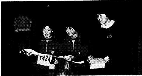
▲ (一箕中の生徒たち) ジュニア文化財の学習