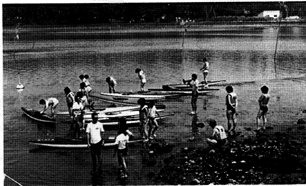
▲ 「海洋活動」でカヌーに挑戦する高校生たち

従来の「勤労青年のつどい」に変わっての新しい事業であるこのつどいには、県内の高校生四十六名が参加し、海水浴や海洋活動・キャンピング・趣向を凝らしたキャンプファイヤー・討議や講演などの多彩なイベントを満喫しながら交友を深めました。