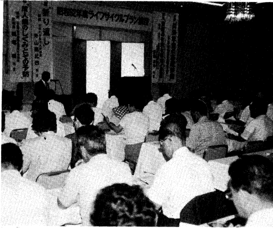
熱心な参加者で埋まった会場

教職員が実年以後も心身ともに豊かな生活を送るための研修会である、ライフサイクルプラン講座が、八月三日～五日の間に、郡山市と会津若松市の二会場において開かれました。 東京から招いた著名な講師等による、豊かな生活設計と健康管理などに関する講義に、参加者は熱心に耳を傾けていました。