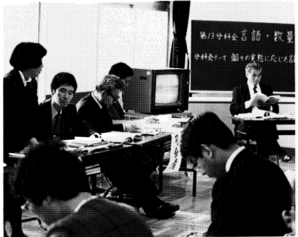
分科会での活発な意見の交換

「一人一人の特性を踏まえた社会的自立を めざす教育活動のあり方を求めて」の大会主 題のもと、全国より特殊教育関係者千名が出 席、二十の分科会をはじめ全体会、講演等実 りある大会となりました。