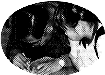
お父さんがんばってね!