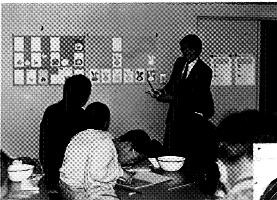
親子の美術館「年賀状版画をつくる」

このページで紹介する年賀状の絵は県立美術館へ届けられた子どもたちの作品 307 点の中から選びました。