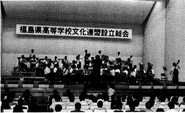
設立総会には県下の高校から2,000名余りが出席

高校生の文化活動向上のうえで永年の懸案であった、県高体連の文化版ともいべき県高文連が昭和六十二年六月十七日に設立され、高等学校文化活動の一層の充実が期待される。