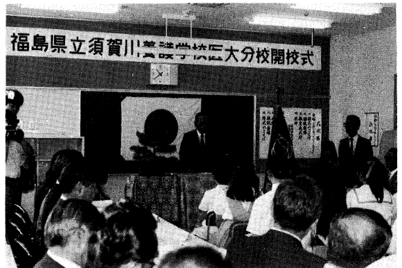
関係者の大きな喜びにつつまれた開校式

PTA、婦人団体、学識経験者等二十人で構成される本会議では、心豊かな児童生徒の育成を図るための道徳教育の充実策などを審議しその成果を学校等に提言することとしている。