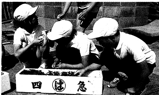
▲一本一本ていねいに、菊のさし芽

この児童の体験を教育活動の基盤に位置づけ、児童の学習能力を引き出す試みが、意欲的に行われています。