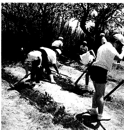
◀ 鉋つかいも上手にジャガイモの手入れ