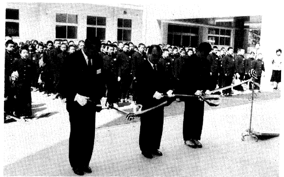
新校舎でのテープカット（安積二中）

印象的な外観とともに、各教室の広い窓、木質フロアは、新鮮で温かい印象を与えてくれます。設備面においても、テレビ、OHPを備えた各教室、広々としたアリーナとミーティングルームのある体育館、広々とした特別