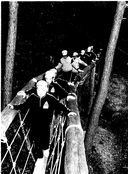
〈サーキットトレーニング〉エリア内