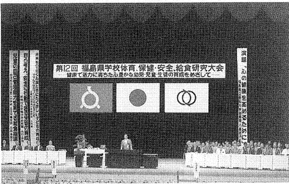
盛大に行われた開会式(二本松市民文化センター)

「健康で活力に満ちた心豊かな幼児・児童・生徒の育成をめざして」の主題のもと研究実践や、当面する諸問題について熱心な協議が行われました。