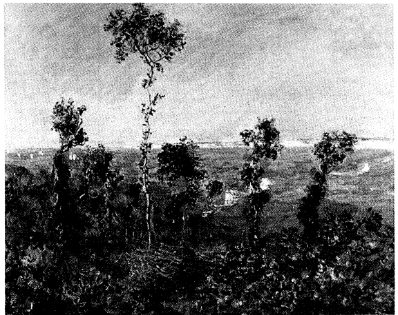
▶モネ「ヴァランジルのくぼ地」

休館日 11月14・21・24・28・12月5 12・19・26～31・64年1月 1～4・9日