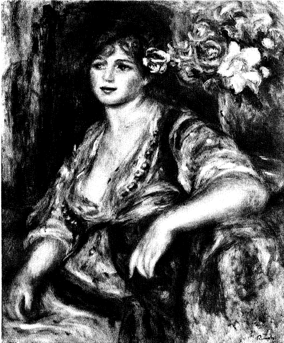
▲ルノアール「バラの髪飾りを付けたブロンド娘」