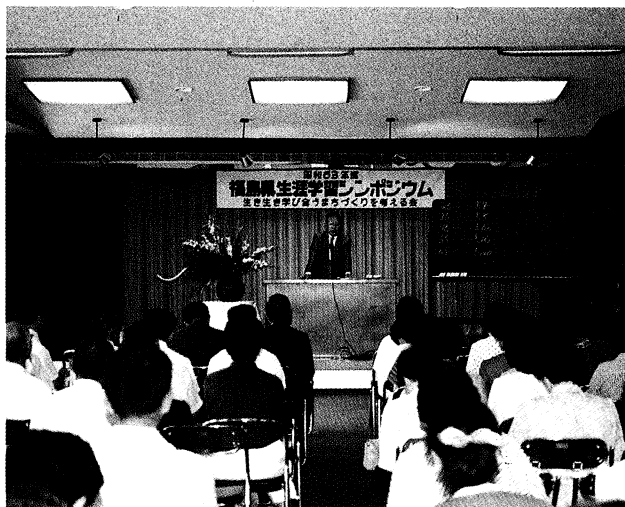
南会津地区シンポジウム (南郷村)

生涯教育の関係者が一堂に会し、市町村における「生き生き学び合う生涯学習のまちづくり」について討議する「福島県生涯学習シンポジウム」が、六十三年度新規事業として九月から十二月にかけて各教育事務所管内で開催されます。 去る九月一日には、南郷村で南会津地区の会合が持たれ、百二十余名の参加者は意見や体験の発表、協議等を熱心に行い、大きな成果を得ました。