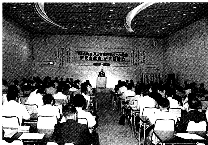
25都道府県から参加し熱心に協議 (いわき市)

東日本高等学校土木教育研究会並びに研究協議会は七月二十八日(木)・二十九日(金)の両日にわたり、いわき市常磐藤原町の常磐ハワイアンセンターで「高等学校土木教育における当面の諸問題について研究協議を行い、土木教育の推進向上と会員の研修を深める」ことを目的として、東日本の二十五都道府県の工業高校や土木科設置校の校長、教頭、教諭など約百五十名が参加し開催されました。