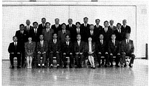
意見発表者及び傍聴者の方々と

今日、教育についての社会の関心は高く、学校に対する県民の期待も大きい。今回は、学校教育に直接、