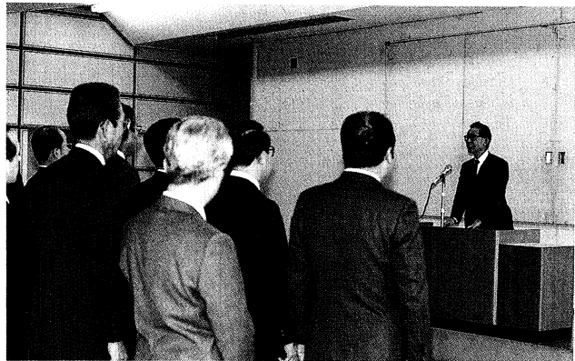
教育庁職員を前に新年への抱負を語る佐藤県教育長(右)