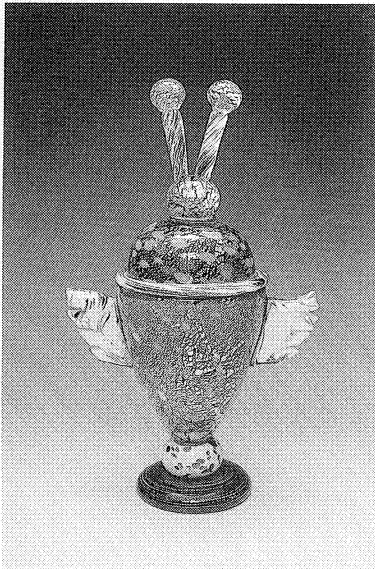
▲横山尚人「羽ばたく黄金の鳥」1986年