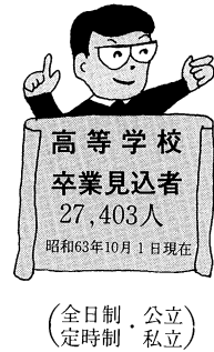
資料：昭和63年度「進路希望調査」